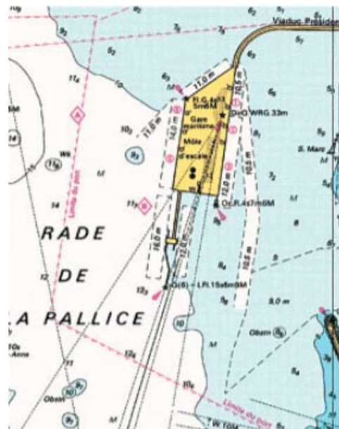
Extraits ENC FR 502270 (à gauche) et carte SHOM 7413 (papier / RNC) à l'échelle 1 de la carte papier